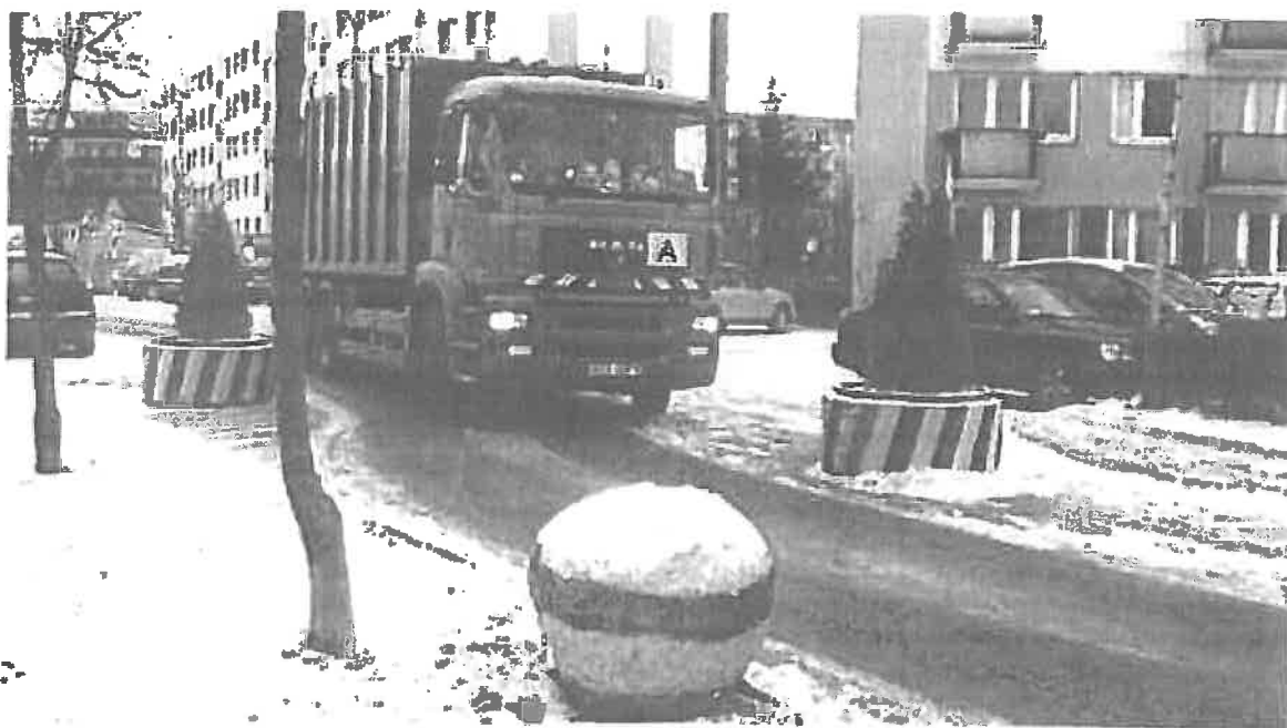
Kwietniki zwalniające ruch na ulicy w Zambrowie.

W Imieniu mieszkańców Kaszczorka którzy podpisali załączoną do niniejszej petycji listę poparcia